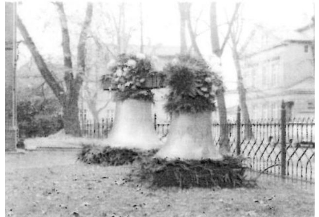
Foto: Glockenweihe 1962

Da spürt man die Weite, wie ein Ausbreiten der Seele ist es, ein Hinüberspannen, eine Antwort auf den Ruf der Unendlichkeit.